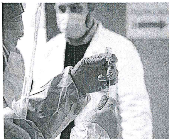
La vertenza promossa dai sanitari che hanno rifiutato il vaccino

Non soltanto un muro contro le pretese dei no vax, insomma, ma anche una resistenza volta a ottenere l'«imprimatur» dei giudici amministrativi sulla legittimità del proprio operato. Ossia, del pugno di ferro. —